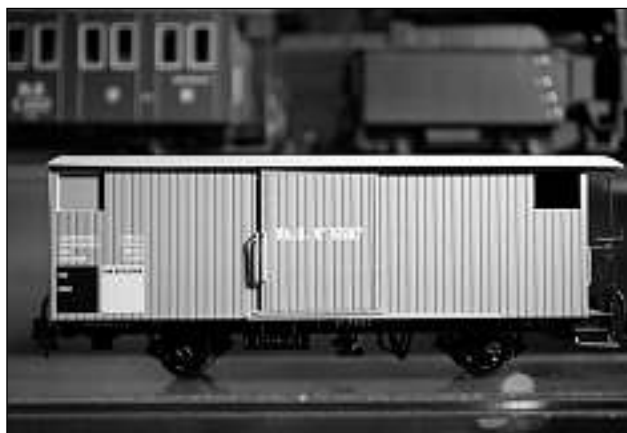
Da 1913 fin 1959 sin las rodaias grischunas.