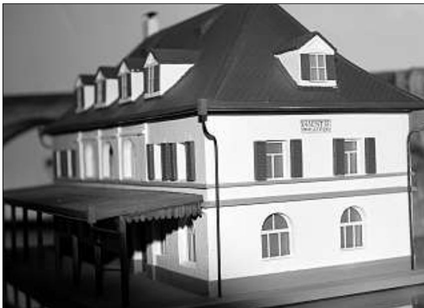
Dapi il 2000 fabritgescha Pirovino era models da staziun, sco quest qua da Mustér.