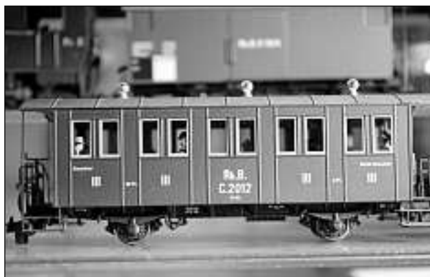
Tut sto constar: En il vagun da pli baud sesan sa chapescha passagiers che portan la moda da pli baud.