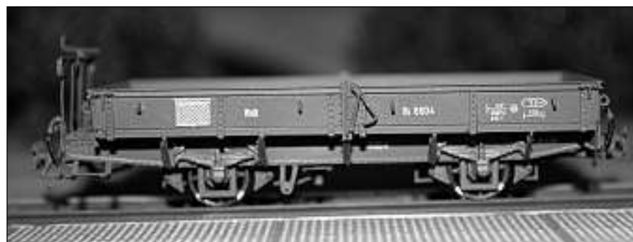
Da quest model è Pirovino fitg losch. El ha lavurà or mintga detagl.