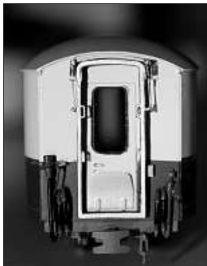
Las duas plimas sura sper l'isch mesiran dus millimeters. Talas piculezzas na datti betg tar models industrials.