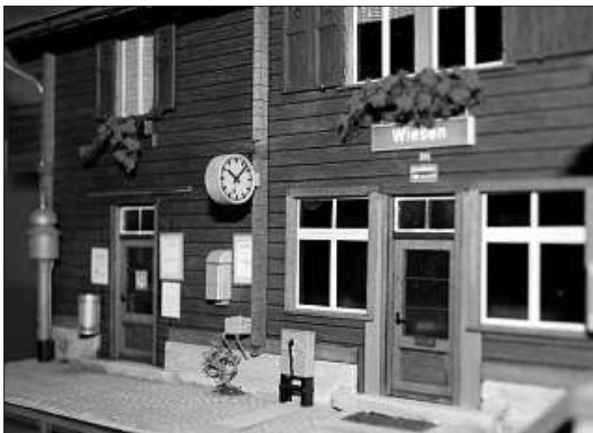
La staziun da Wiesen vegn dumandada il pli savens. L'ura mesira 12 millimeters. I dat in model ch'è anc pli pitschen.

Per la firma Starrag è Pirovino i plirs onns sin montascha en l'exteriur. En sia valischa aveva el adina material per fabritgar models. Quai è stà l'occupaziun durant bleras fins d'emna en l'exteriur – fin ch'il hobi è daventà professiun.